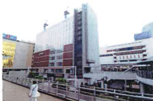
JRや東武線、京成線が集まる船橋駅周辺は西武や東武など大型店が多く駅ビルも建設中

不動産経済研究所（東京・新宿）の調べでは、東京23区の新築マンションの平均販売価格は16年度で6762万円。5年前より27%も上昇している。ライフルホームズ総合研究所（東京・千代田）の高橋友也氏は「都内は一般の人に手が届かない高額物件が増えた。消費者は現実的に予算を考え、利便性が高い穴場を探すようになってきた」と解説する。