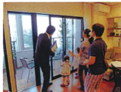
船橋駅に近いマンション「ヴィークコート船橋本町」のモデルルームには都心からも見学者が来る

大型商業施設の「ららぽーとTOKYO-BAY」も船橋市内にあり、バスや京成線で行ける。こうした便利さに魅力を感じる人は多い。繁華街がにぎわい、郊外には2つの競馬場もあるため治安が心配されがちだったが、再開発で街並みが整い、犯罪発生件数も減少傾向にある。